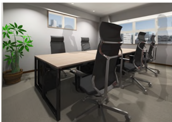
[完成予想パース（個室）]

【WEBサイト】 http://www.bistation.jp/shinyokohama