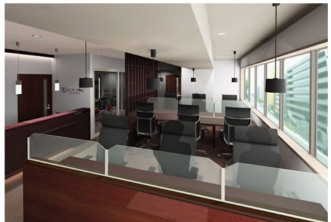
[完成予想パース（左：会議室、右：コワーキングスペース）]